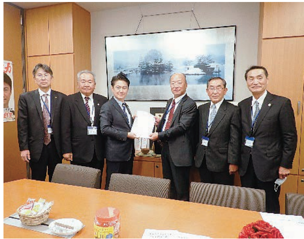
山下貴司衆議院議員