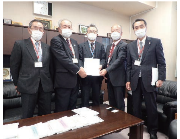
奥田透農村振興局長【農林水産省】