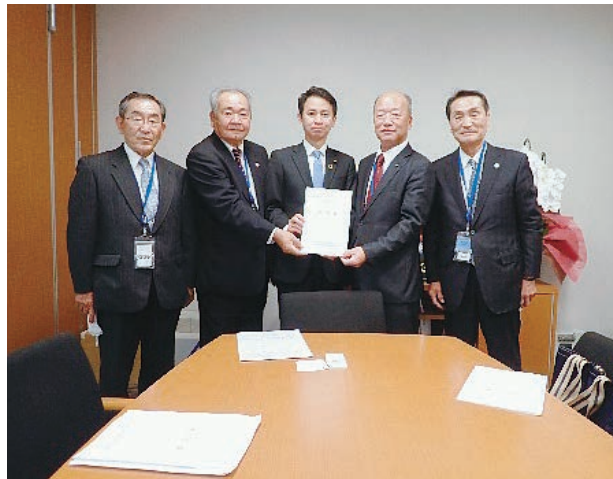
谷合正明参議院議員