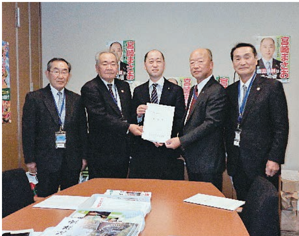
宮崎雅夫参議院議員