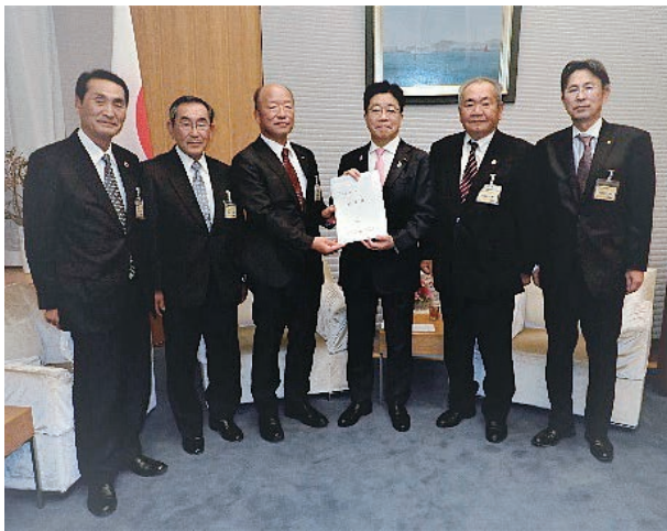
加藤勝信内閣官房長官