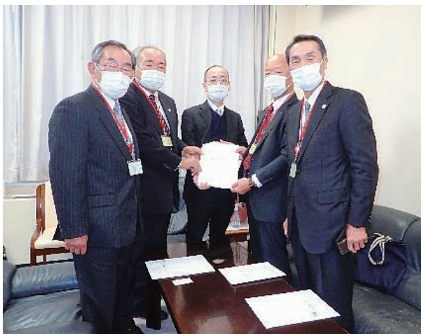
安部伸治農村振興局整備部長【農林水産省】