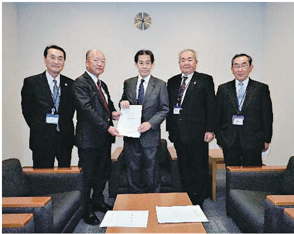
逢沢一郎衆議院議員