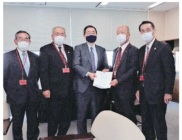
内藤尚志自治財政局長【総務省】