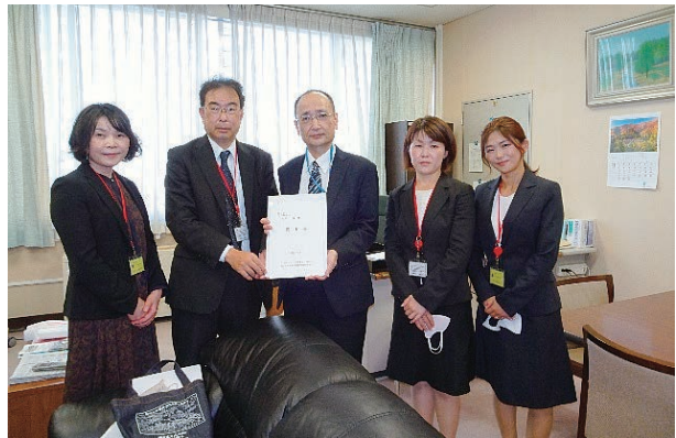
安部伸治農村振興局長【農林水産省】