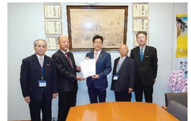
加藤勝信衆議院議員への要請活動

閉会后、岡山県からの参加者は、採択された要請書により岡山県選出の国会議員へ要請活動を行った。