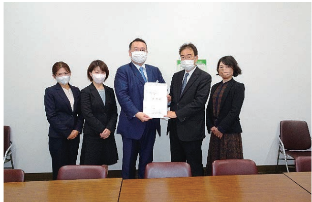
野村宗成主計局主計官【財務省】