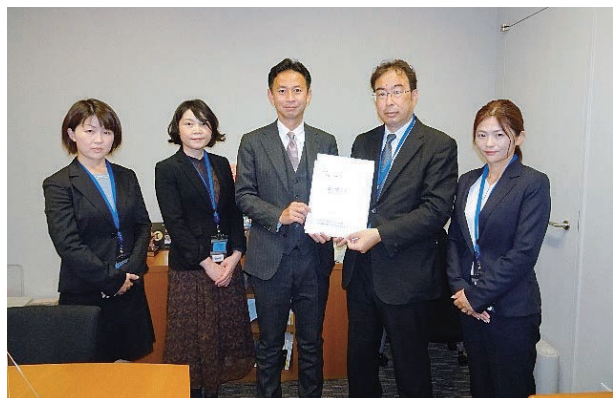
谷合正明参議院議員