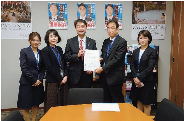
進藤金日子参議院議員