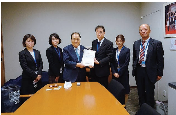
片山虎之助参議院議員