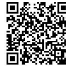
協議会 HP の二次元コード

https://www.okadoren.or.jp/daikukakuka.html (岡山県土地改良事業団体連合会のHP内)