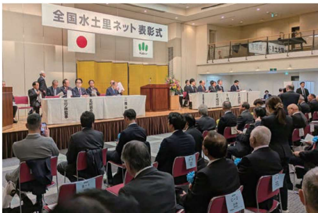
全国水土里ネット表彰式の様子